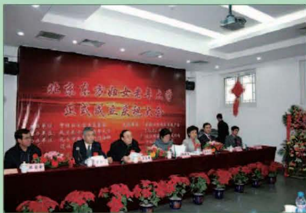
▲ 2008年2月9日(元宵节),北京东方妇女老年大学在北京市西城区什刹海街道社区活动中心举行庆祝成立大会