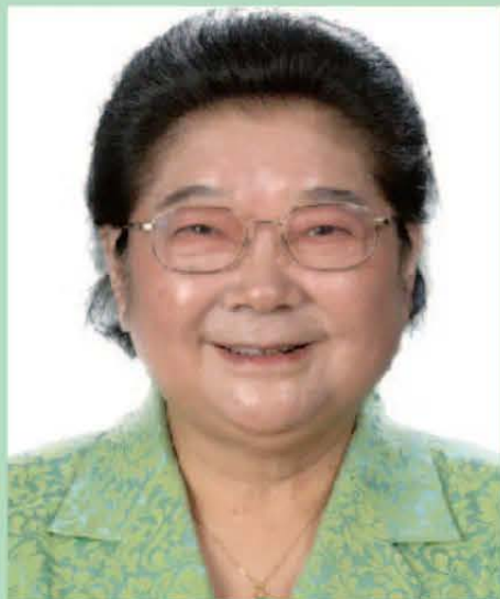
▲ 学校荣誉校长、首任校长为第十届全国人大副委员长顾秀莲

北京东方老年研修学院(原北京东方妇女老年大学)举办单位为中国下一代教育基金会,北京市教委和民政局批准注册,于2007年10月成立,2009年列为北京市属民办非学历高等教育机构。2010年荣获北京市政府授予“北京市敬老爱老为老服务先进单位”奖牌。2016年先后被北京老年大学联谊会评为“示范校建设先进老年大学”,被中国老年大学协会评为“全国示范老年大学”。2017年被北京市民政局评为“AAAA级”社会组织、被北京市教委评为优级学校。